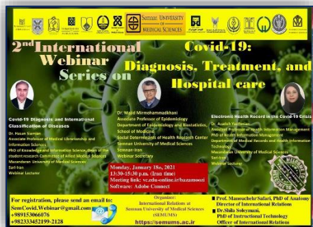
دومین وبینار بین المللی با عنوان "کووید ۱۹: تشخیص، درمان، مراقبت های بیمارستانی" ۹۹/۱۰/۲۳