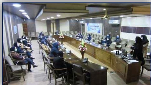
برگزاری نشست نمایندگان واحد آموزش در مرکز بهداشت شهرستان سمنان ۹۹/۱۰/۲۳