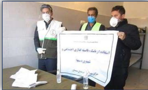
حضور تیم مراقبتی مرکز بهداشت شهرستان سمنان در پلیس راهور ۹۹/۱۰/۰۸