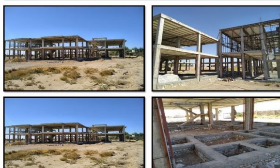
عنوان پروژه: احداث خوابگاه دانشجویی شهرستان آرادان- خیرین