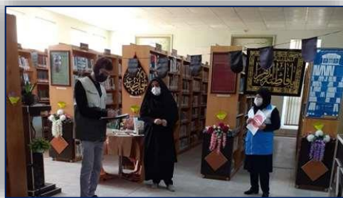
بازدید کارشناس بهداشت محیط و ناظران سلامت شهرستان گرمسار از اماکن تجمعی ۹۹/۱۰/۳۰