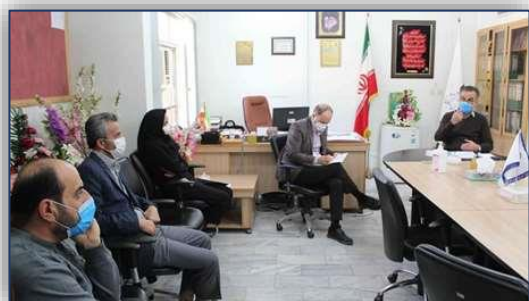
برگزاری جلسه شورای امر به معروف و نهی از منکر شبکه بهداشت و درمان دامغان ۹۹/۱۰/۰۶