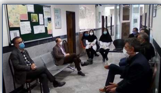
برگزاری جلسه هماهنگی برای اجرای برنامه های مبارزه با سالک در مرکز امیریه شهرستان دامغان ۹۹/۱۰/۰۷