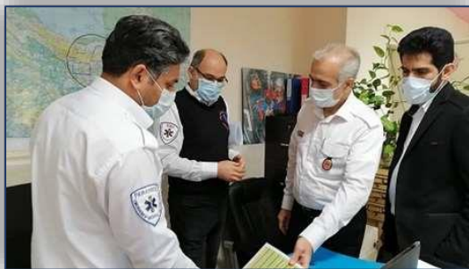
نشست صمیمی مدیر حوادث و فوریت های پزشکی دانشگاه با کارشناسان سازمان اورژانس کشور ۹۹/۱۰/۱۷