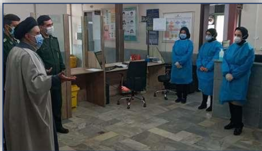
قدردانی مسئولین سپاه شهرستان سمنان از عملکرد مطلوب مراکز منتخب کووید ۱۹ در شهرستان سمنان ۹۹/۱۰/۰۸