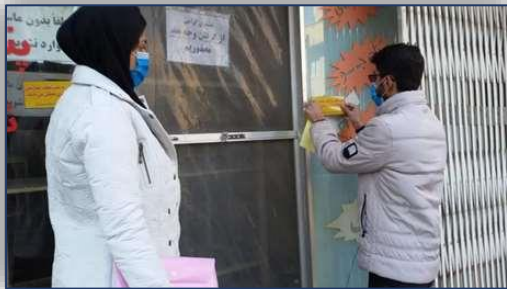
تعطیلی یک واحد متخلف نانوائی شهرستان سمنان به علت عدم رعایت موازین بهداشتی ۹۹/۱۰/۱۳