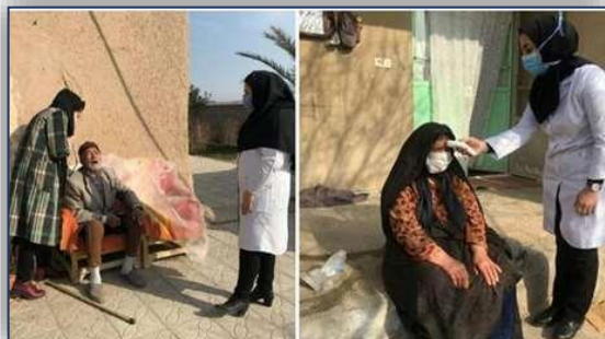
خدمات تیم های Home Care شبکه بهداشت و درمان شهرستان گرمسار در طرح شهید حاج قاسم سلیمانی ۹۹/۱۰/۰۲