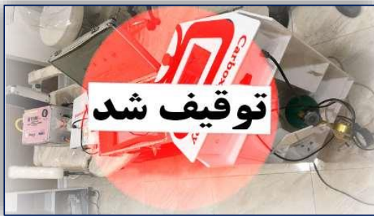
آرایشگر متخلف گرمساری به کمیسیون ماده ۱۱ دانشگاه معرفی شد ۹۹/۱۰/۰۸