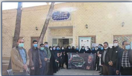
تقدیر از خدمات مطلوب مرکز خدمات جامع سلامت مرحوم دانائی ۹۹/۱۰/۱۳