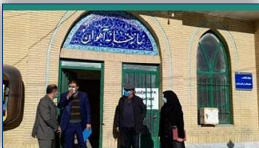
انجام گشت مشترک واحد مهندسی بهداشت محیط، اداره راهداری و فرمانداری ۹۹/۱۰/۱۰