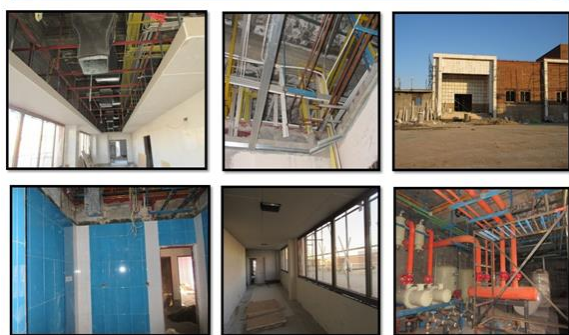
عنوان پروژه: احداث بخش سوختگی و سرطان مرکز آموزشی پژوهشی درمانی کوثر شهرستان سمنان