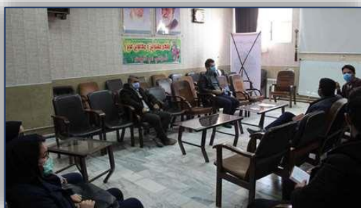
تشکیل جلسه کمیته رهگیری و مراقبت در طرح شهید حاج قاسم سلیمانی در شبکه بهداشت و درمان شهرستان دامغان ۹۹/۱۰/۰۳