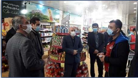
بازدید شبانه مسئولین شهرستان گرمسار از داروخانه ها و فروشگاه های زنجیره ای سطح شهرستان ۹۹/۱۰/۱۳