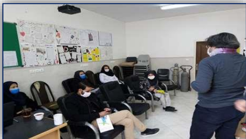
برگزاری جلسه آموزشی بیماریهای واگیر تحت مراقبت کشور در مهمانشهر مهاجرین خارجی ۹۹/۱۰/۲۳